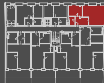
situace bytové jednotky celkový půdorys