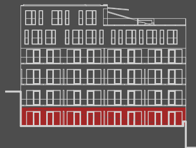
situace bytové jednotky dvorní pohled